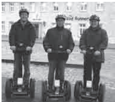
Im Hintergrund der Firmensitz von Road Runner Osnabrück am Hauptbahnhof

Na dann mal los! StadtLand Führungen Osnabrück bietet verschiedene geführte Touren mit viel Fahrspaß und Informationen an. Nach Ihren Wünschen und Vorstellungen können die Touren verändert werden. Wir können z. B. andere Start- oder Abholpunkte, Halb- und Tagestouren oder Nachtfahrten organisieren. Wir bringen Ihnen die Segway - Fahrzeuge oder holen Sie und die Elektroroller mit dem Bus wieder ab. Sie möchten angrenzende Stadtquartiere kennenlernen, unterwegs eine Kleinigkeit essen und in Ruhe eine Pause genießen oder zwischendurch etwas klettern, vielleicht Boot fahren? Wir können über den Haseuferweg „Zur alten Eversburg“ fahren, ein Stück entlang des Stichkanals zu „Tante Anna“ düsen, ins Nettetal gemütlich zum „Hof-Bistro Nettetal“ rollen, bei „Zum Amtsrichter“ in Bramsche oder am Dümmer rumkurven? Fragen Sie nach. Geeignet für „fast“ alle Altersstufen hat der Spaß einen Preis. Wir nennen Ihnen die Kosten. Tel. 0541 - 2029972