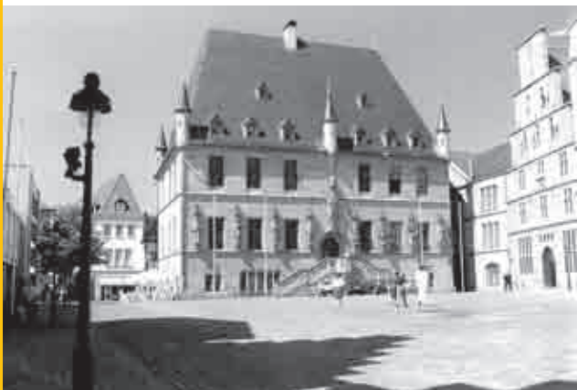
Rathaus des Westfälischen Friedens 1648

Planen Sie mit uns Ihr maßgeschneidertes Osnabrück - Erlebnis!